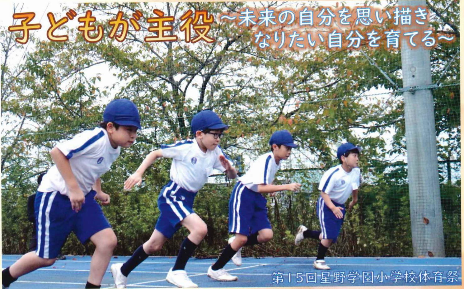
第15回星野学園小学校体育祭